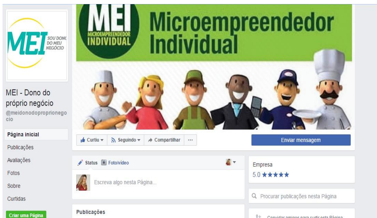
Imagem 1- Página criada MEI- Dono do Próprio Negócio